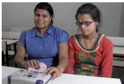
Deux femmes utilisent un appareil de lecture DAISY.

Votre entreprise ou votre gouvernement peut apporter une contribution? Les dons, quel qu'en soit le montant, sont les bienvenus et peuvent être réservés au financement de projets donnés. Nous acceptons également les contributions en nature.