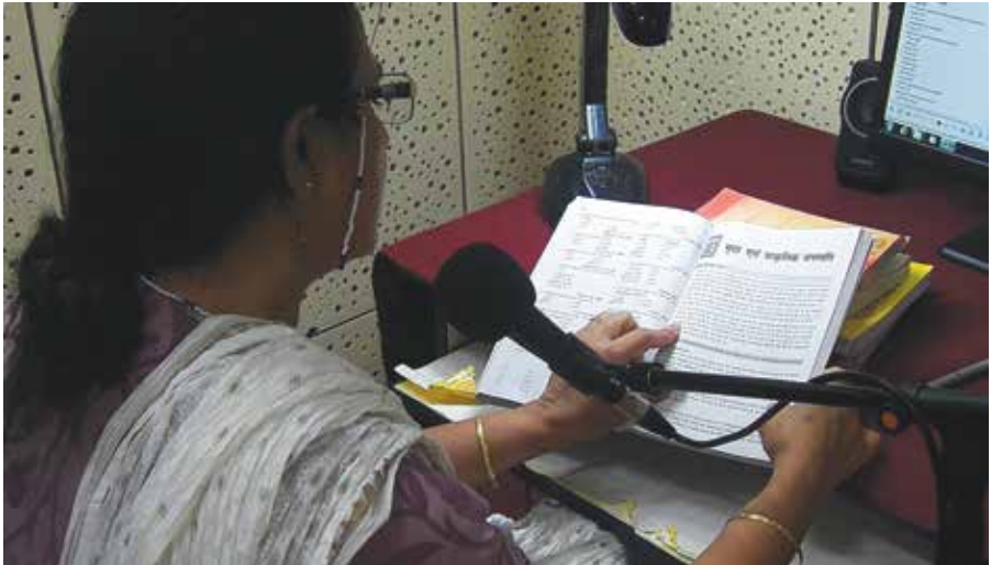
Une femme enregistre un livre audio.

les pays en développement et les pays les moins avancés. Par exemple, grâce au soutien financier apporté par le gouvernement de l'Australie, le consortium ABC a pu financer le déplacement de travailleurs d'une ONG de Chittagong (Bangladesh) à Kolkata (Inde) pour qu'ils bénéficient d'une formation aux technologies les plus récentes, y compris la production de livres audio. Ces travailleurs formés utilisent à présent au Bangladesh les compétences acquises pour convertir au format audio les livres les plus demandés par les étudiants de l'Université de Chittagong.